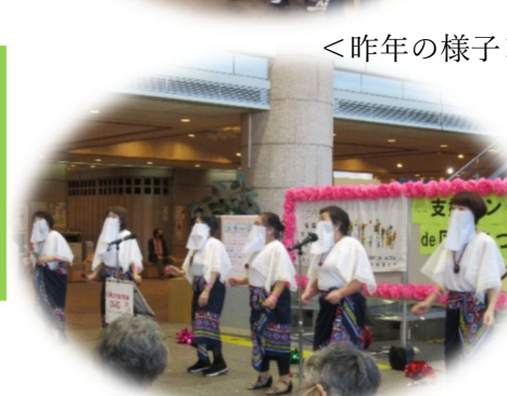
< 昨年の様子(会場はイメージ) >

日頃の成果を区民の皆さんに披露しましょう! たくさんの方々に楽しんでいただくチャンスです。