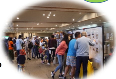
< 昨年の様子 >

作品やパネルを展示して活動を紹介しましょう。団体の 会員募集やパートナーズのPRの絶好の機会です!