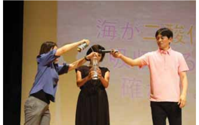
依田さんと来場者の方が一緒に実験！