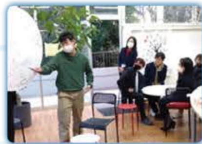
青少年の地域活動拠点でのワークショップ