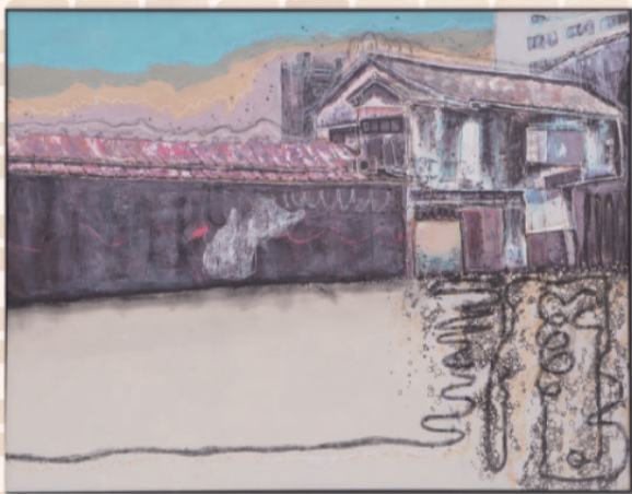
第4回 大賞「panoramic holiday」