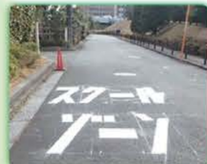
スクールゾーンの交通安全対策