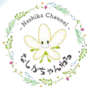
子育て応援系YouTubeチャンネル