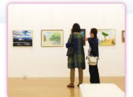
あおば美術公募展