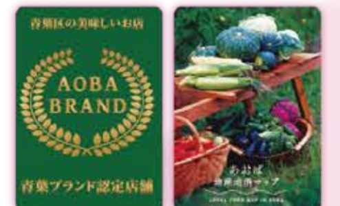
青葉区の美味しいお店「青葉ブランド」のロゴ