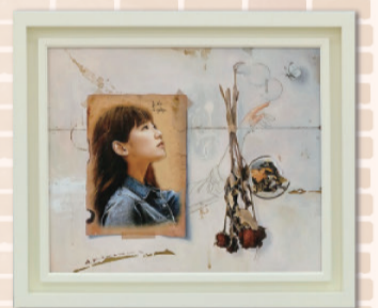
第3回 小品佳作賞「ある壁の詩」