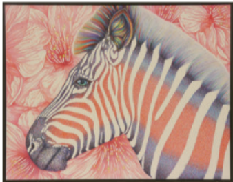
第1回 特別審査委員賞 「耳をすまして」