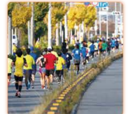
青葉区民マラソン