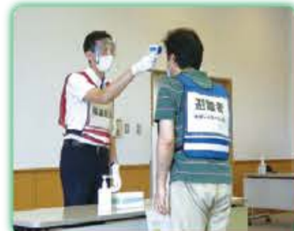
避難所運営に関する研修会