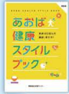
あおば健康スタイルブック