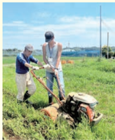
▲畑を耕す様子

農業はさまざまな工程があり、障害者の皆さんが活躍する場として「農福連携」は 注目されています。また、高齢化や担い手不足などの課題がある地域の農業を、 未来へつなぐ方法の一つとなることが期待されます。