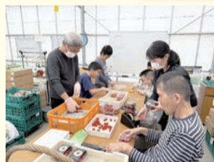
▲ミニトマトをバックに詰める様子 Universal Agriculture Support 合同会社(鉄町)