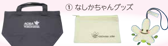
① なしかちゃんグッズ