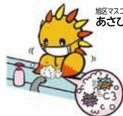
旭区マスコットキャラクター あさひくん