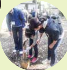
親子野外自然体験活動の様子