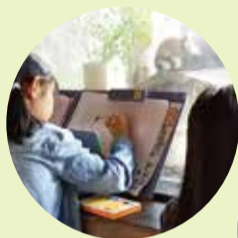
こども写真大会の様子

学校音楽祭・大なわとび大会・夜間パトロールなど、年間を通じて様々な活動を行っています。