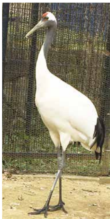
タンチョウのオタル

タンチョウには、中国東北部やロシア極南東部で繁殖し、中国東海岸沿いや朝鮮半島で越冬する大陸の集団と、北海道に留鳥として生息する集団が存在します。アイヌ語では「サルルンカムイ(湿原の神)」と呼ばれており、日本で繁殖する唯一の野生のツルです。 しかし、タンチョウは世界に2,800羽程度しか生息しておらず、日本では特別天然記念物に指定されています。 2020年3月24日、ズーラシアの開園以来初めて、千葉市動物公園からタンチョウ(愛称:オタル)が来園しました。皆さんぜひズーラシア初となるタンチョウの姿を見に来てください!