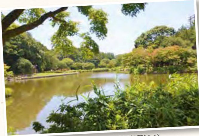
▲こども自然公園の大池(大池町65-1)

*尻子玉とはお尻の中にあると想像された架空の臓器。これを取られると心が病んでしまうといわれています。