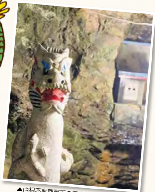
▲白根不動尊裏手の洞窟(白根3-26-1)

まだ白根のお不動様が池に囲まれていたころ。村人が白根橋で休んでいると、橋の下からザザーツという大きな音が聞こえてきます。びっくりして橋の下を見ると、大きな龍が音を立てて、中堀川の清流を白根不動に向かって泳いでいたのです。後を追うと、お不動様の脇にある清水の中で、ジュンサイ(水草)をおいしそうに食べていました。食べ終わった龍は、中堀川を下り帷子川を通過して、峯の円海山(磯子区)の方へ向かって行ったそうです。