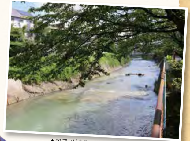
▲帷子川(今宿~鶴ヶ峰周辺)

200年ほど前、今宿から鶴ヶ峰の付近に村人に農さをするという親子3匹のカッパが現れ、畑の中で作物を食べ荒らしていました。そこを村人に見つかり、父さんカッパが捕まって桑の木にくくりつけられてしまいました。