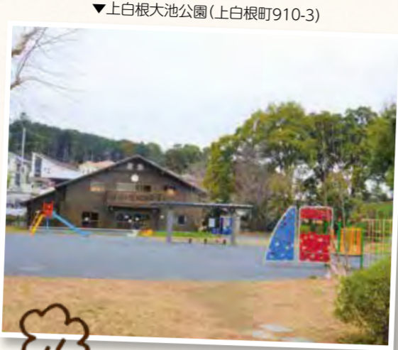
▼上白根大池公園(上白根町910-3)

昔、上白根大池公園は大きな池になっていて、この池で成長した大蛇が村人を困らせていました。人々は池に焼いた石を投げ入れて大蛇をおびき出し、退治しました。その後、大蛇のお墓を作り供養することで、平穏さを取り戻したそうです。