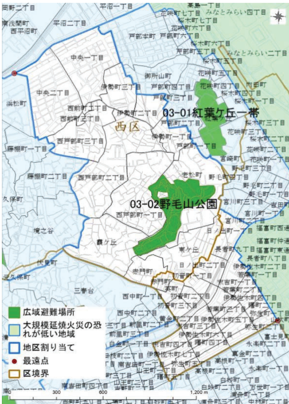
最遠点: 広域避難場所の外縁部から直線距離で最も離れている地区割り当ての端点