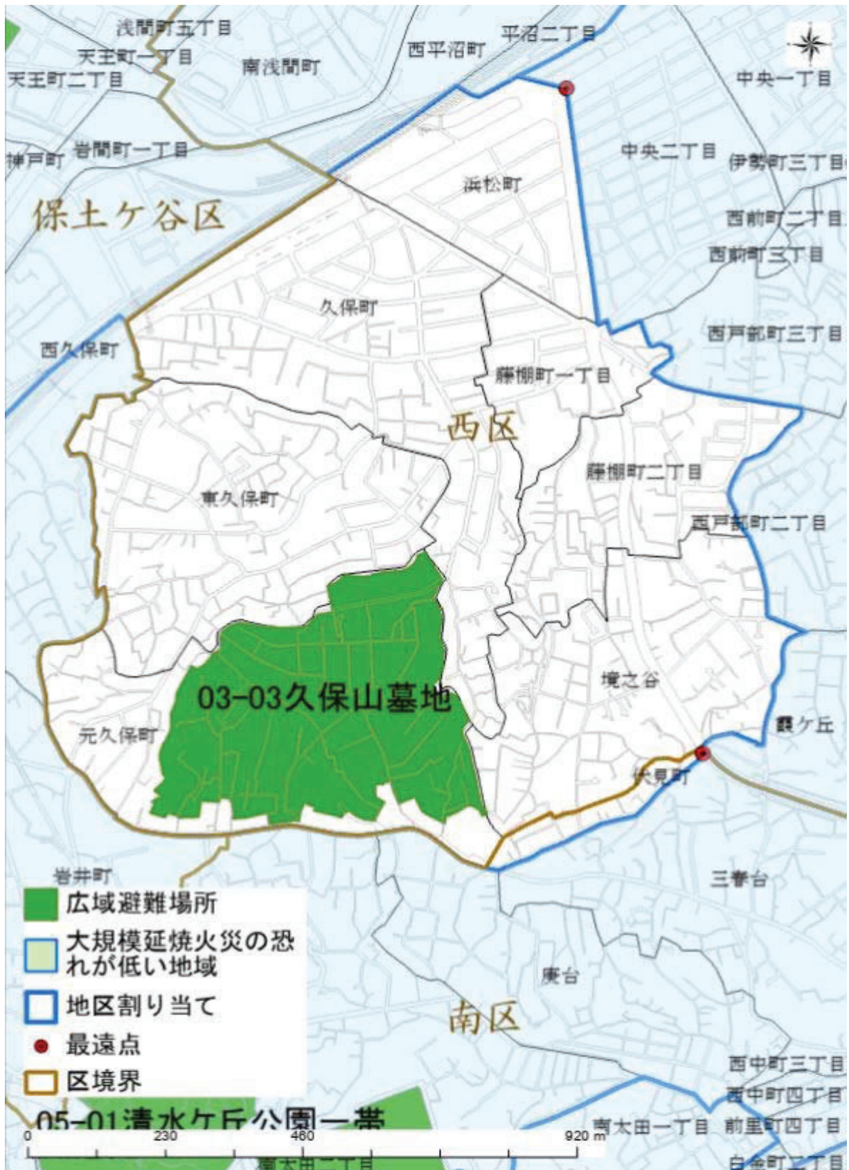
最遠点: 広域避難場所の外縁部から直線距離で最も離れている地区割り当ての端点