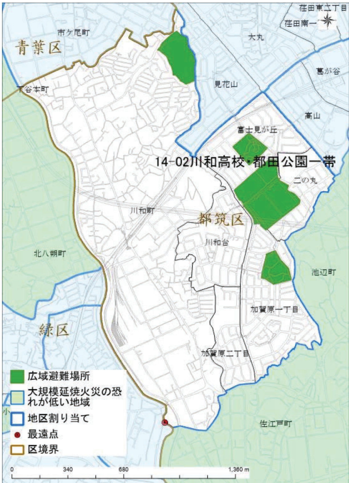
最遠点：広域避難場所の外縁部から直線距離で最も離れている地区割り当ての端点