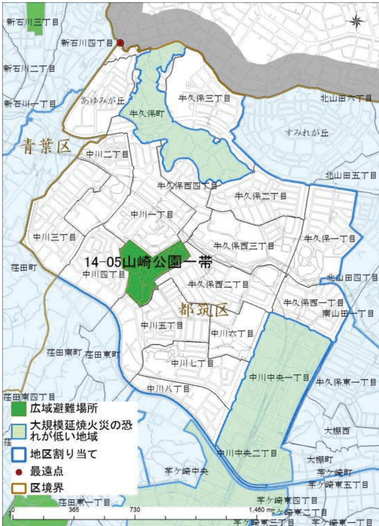
最遠点: 広域避難場所の外縁部から直線距離で最も離れている地区割り当ての端点