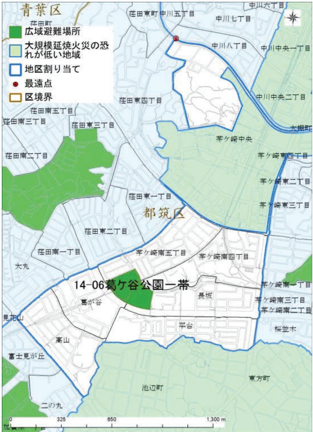
最遠点：広域避難場所の外縁部から直線距離で最も離れている地区割り当ての端点