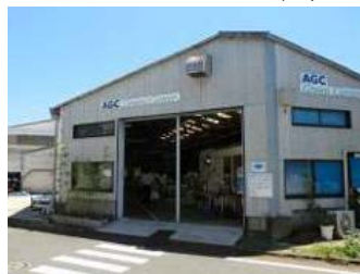
グリーンセンター