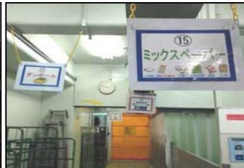
保管場所の掲示物