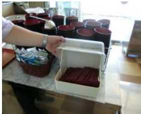
リユースコーナー