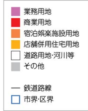
■ 区別商業系土地利用面積(ha)

*グラフの数値は上から、業務用地、商業用地、宿泊娯楽施設用地、店舗併用住宅用地 の面積を示しています。