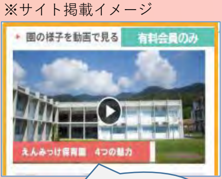
※サイト掲載イメージ