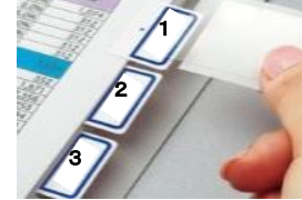
【インデックスのイメージ】