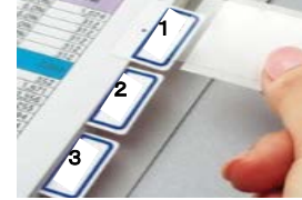
【インデックスのイメージ】