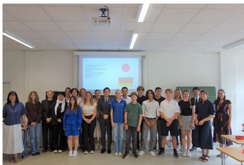
シューレ・アム・リード校訪問の様子

ドイツの子育て施策の特徴的な事例として、子どもたちが自然の中で一日の大半を過ごす「森の幼稚園(保育園)」を訪問しました。「子育てしたいまち 次世代を共に育むまち ヨコハマ」に向けて、運営団体と意見交換を行いました。