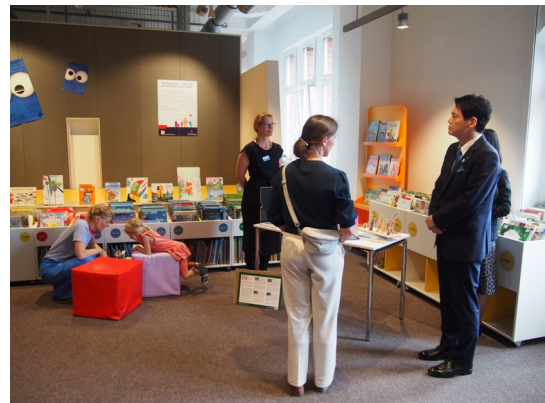
ハンブルク中央図書館視察の様子