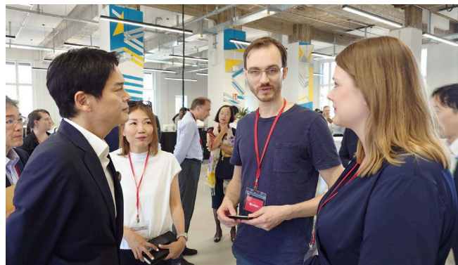
ネットワーキングの様子