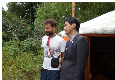
「森の幼稚園 (保育園)」訪問の様子