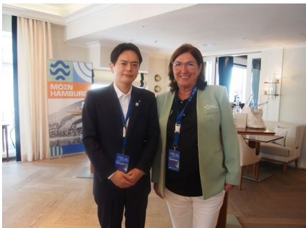
ワールドトライアスロン

7月13日からハンブルクで開催された、ワールドトライアスロンシリーズハンブルク大会を視察しました。今大会の視察及び大会関係者との意見交換等によって得た先進的事例や運営ノウハウ等の知見を、ワールドトライアスロン・パラトライアスロンシリーズ横浜大会の更なる発展及び街のにぎわい創出につなげます。