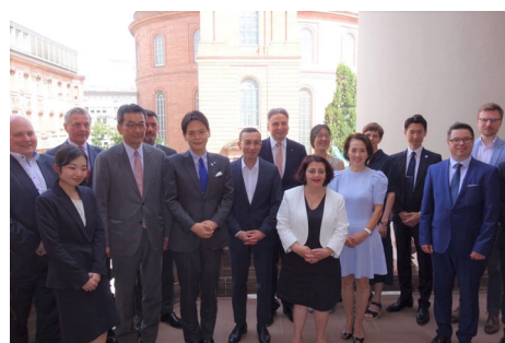
更新協定書調印式に参加された皆さんと