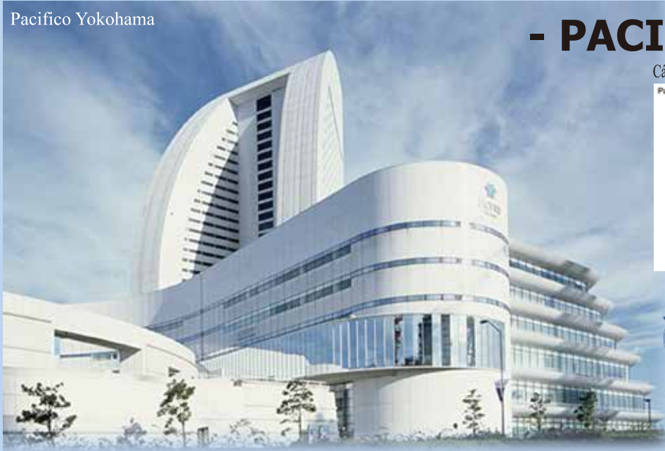
* Nguồn: Tổng cục Du lịch Nhật Bản