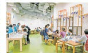
わくわくデスク 楽しく学べるキットやゲームを選んで体験