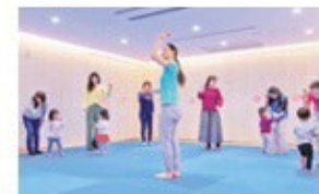
わーくしょっぷスタジオ 幅広い対象者向けワークショップを開催