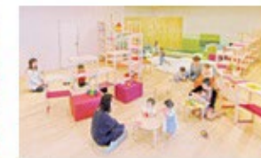
ちびっこガーデン 未就学児と保護者が安心して遊べる部屋