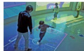
デジタルきんばす 体を動かして映像で遊ぶ体験