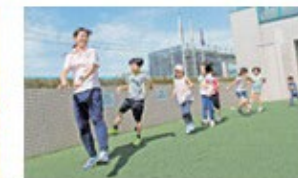
ちゃれんじコート 元気いっぱい、人工芝の屋外広場