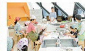
とんがりキッチン 充実した設備で楽しく料理を体験