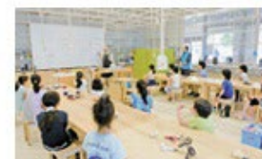
ものづくりガレージ オリジナルの工作や実験を体験