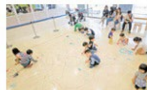
ホワイトあとりえ 床一面をキャンバスに自由にお絵かき