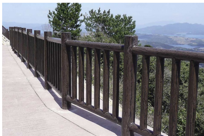
↑ 擬木フェンス事例②