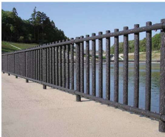
↑ 擬木フェンス事例①