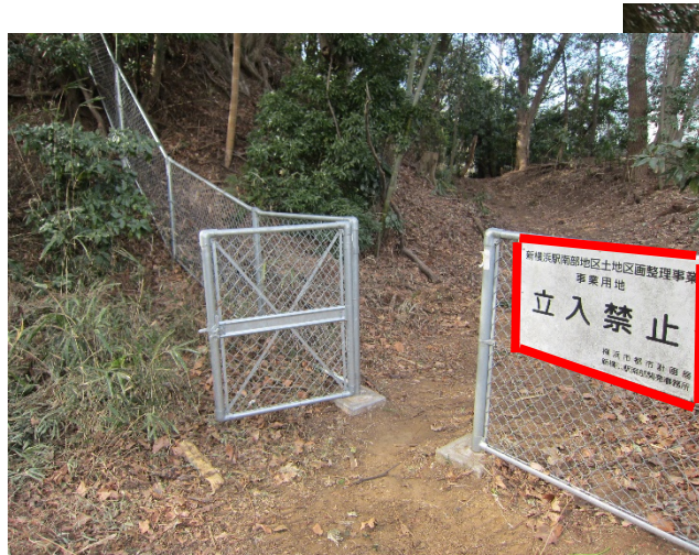
↑再固定する立ち入り禁止案内板