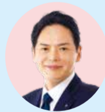
やまなか たけはる 山中 竹春 横浜市長