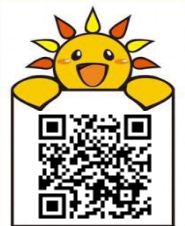
旭区マスコットキャラクターあさひくん

共に歩む市民の会ホームページ( http://tomoni-people.net ) または 二次元バーコードより横浜市公式 YouTube チャンネルへ アクセスください。