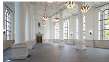
施設内観（1階ホール）