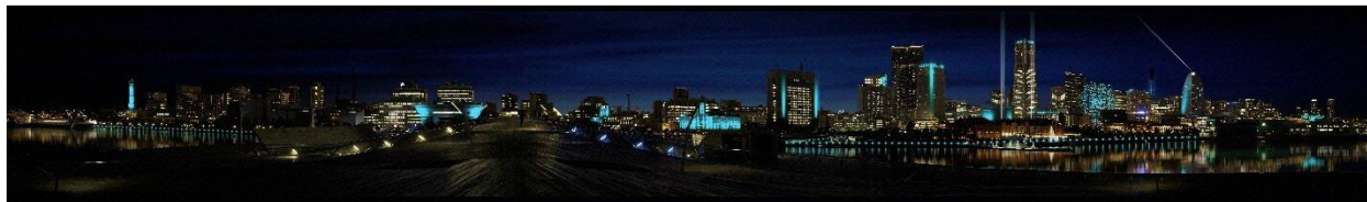
NIGHT VIEWING(大さん橋から山下公園側とみなとみらい側を臨む)