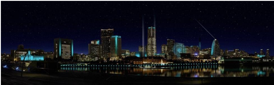
NIGHT VIEWING(大さん橋からみなとみらい側を臨む)

1日8回各5分間、広場と周辺の27施設が連動した街ぐるみのダイナミックな光と音の演出を、新港中央広場や横浜港大さん橋国際客船ターミナルなど横浜の様々なスポットからお楽しみいただけます。また、今年は赤レンガパーク等の水際線や山下公園側の施設を新たに増やし、ビューポイントの横浜港大さん橋国際客船ターミナルからは、これまでにない都市的スケールの光と音楽の演出が体感できます。