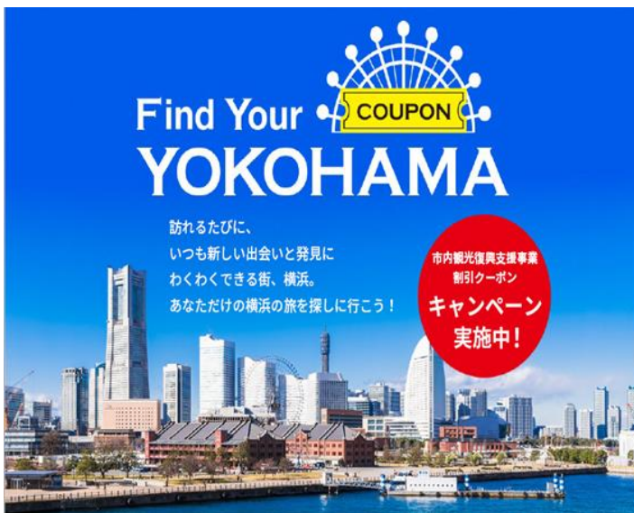
（キャンペーン特設ページイメージ）