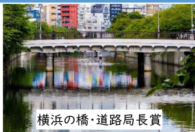
横浜の橋・道路局長賞