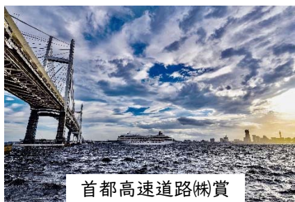
首都高速道路(株)賞