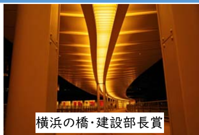
横浜の橋・建設部長賞