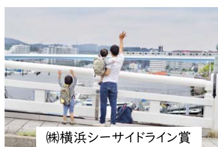
(株)横浜シーサイドライン賞