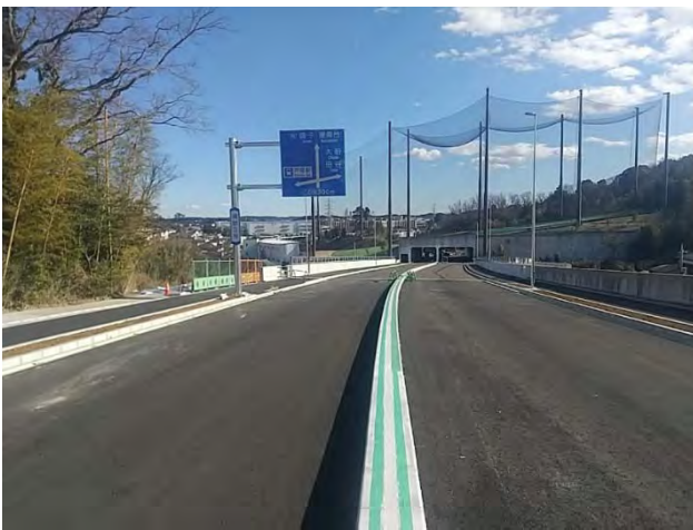
開通区間中央付近から日之出橋交差点方向を望む （令和 4 年 2 月撮影）