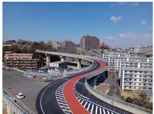
環状 3 号線から国道 1 号接続ランプを望む （令和 4 年 3 月撮影）