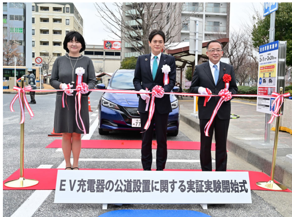
左から四ツ柳社長、山中市長、高橋副議長