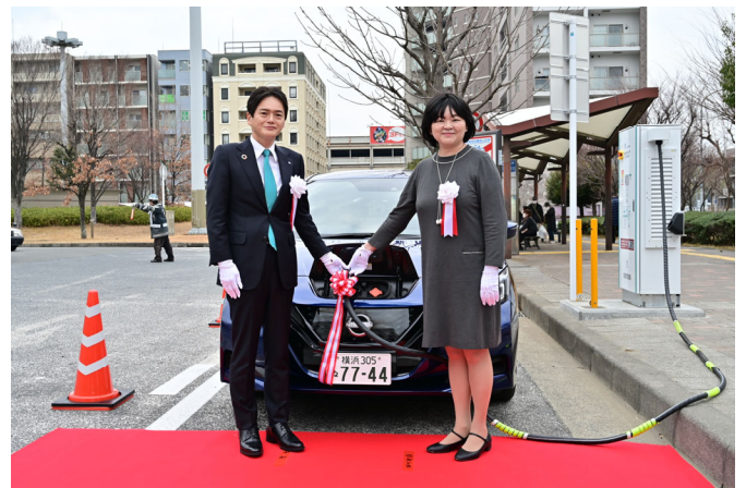
左から山中市長、四ツ柳社長