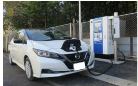
EV用急速充電器の設置イメージ