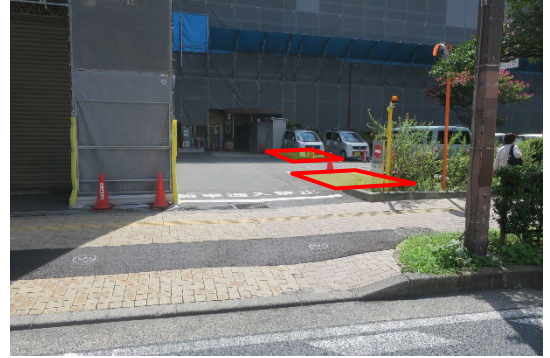
鶴見区総合庁舎の公用車駐車場内 ※駐車枠内どちらか1か所を想定