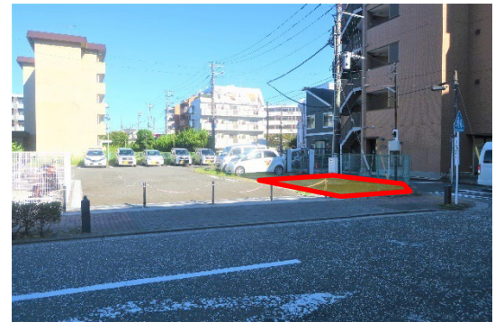
金沢区総合庁舎東側の公用車駐車場内