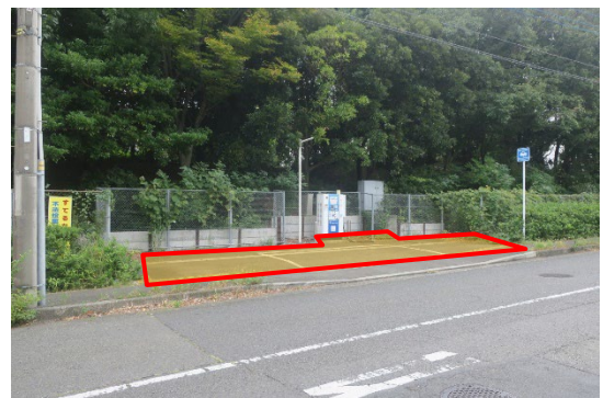
資源循環局都筑工場西側