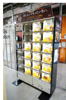
【参考】ブルーライン関内駅 食品ロス削減 SDGs ロッカー