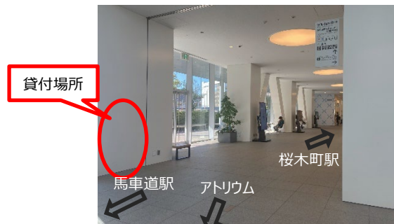
貸付場所の位置（市庁舎1階）