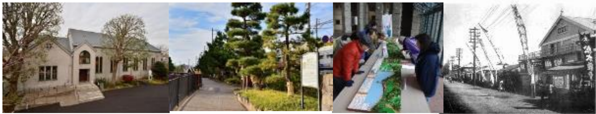
保土ヶ谷区内の魅力あるポイントを巡ります