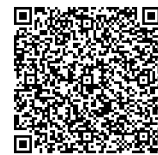
電子申請二次元コード

※詳しい申込方法・コース詳細は右記イベントHPをご覧ください。 https://www.city.yokohama.lg.jp/hodogaya/shokai/miryoku/tokaido/rekishi-event.html