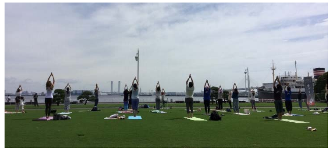
↑ 1回目の試行時の様子