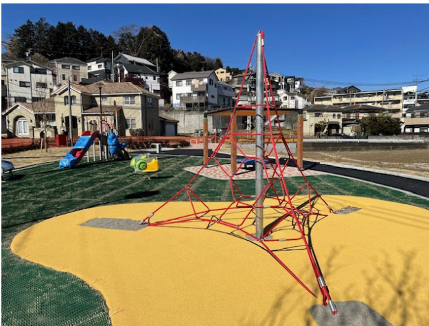
遊具広場（令和7年2月撮影）

遊具広場（約900m 2 ）：幼児用複合遊具、スイング遊具、ザイルクライム、パーゴラ等 入口広場（約5,840m 2 （調整池含））：健康器具系施設3基、パーゴラ等