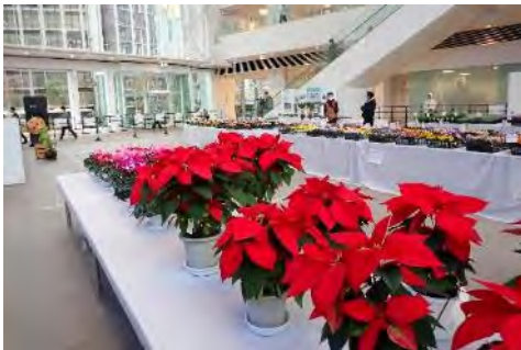
昨年の一般公開の様子

横浜市内の生産者が丹精込めて育てた色とりどりの花々を一堂に集め、その美しさを競う展覧会は、一般公開もしております。冬を華やかに彩る花の祭典にぜひお越しください。