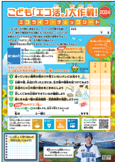
エコライフ・チェックシート (表面)