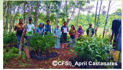
苗木を受け取ったときの様子

フィリピンでは気候危機や自然災害の影響を受けやすく、人びとの生活が苦しくなっています。食料支援を行う国連 WFP はマングローブの保護や植樹活動などを通じて、フィリピンの人びとの日々の生活をサポートします。