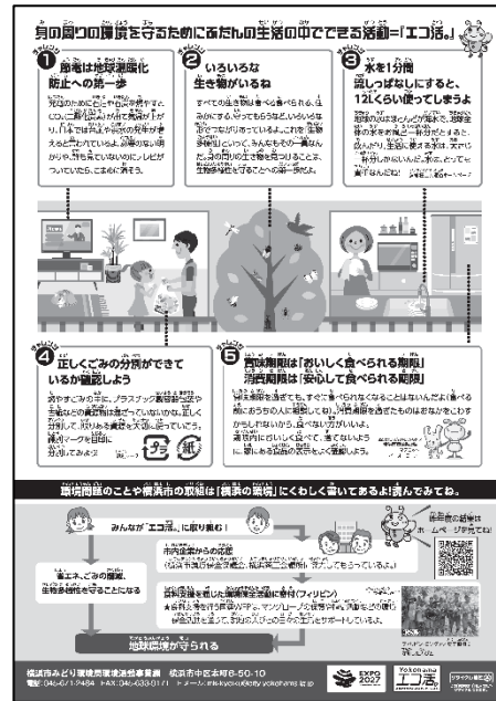
エコライフ・チェックシート (裏面)