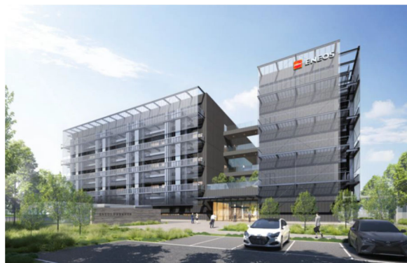
ENEOS株式会社 中央技術研究所 新研究棟（外観イメージ）