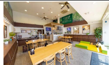
住まいる Cafe 鶴見西 内観

マンションや一戸建住宅、土地の購入や売却のほか、貸したい、リフォームしたいなど、お住まいに関するご相談にワンストップで対応する店舗です。