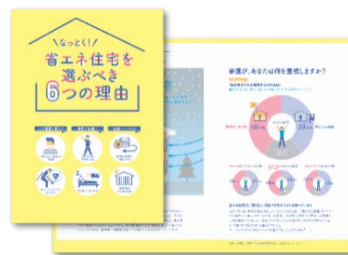
省エネ住宅のリーフレット