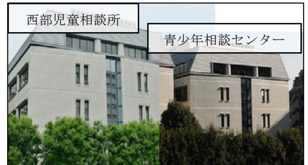
星川駅からの写真