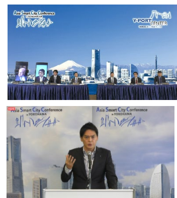
第10回アジア・スマートシティ会議の様子

【取材申込み先】 メールアドレス: ki-asca@city.yokohama.jp