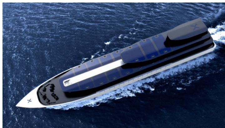
電気運搬船のイメージ図

電気運搬船は、船に搭載した蓄電池に蓄電し、電気を海上輸送するという世界初の送電手段です。我が国は2050年までにカーボンニュートラルの達成を目標に掲げ、洋上風力については排他的経済水域(EEZ)まで広げる検討を含め、積極的な再生可能エネルギーの導入が行われています。日本の海域の水深は深く、特にEEZではこれまでの送電手段で送電が可能な水深300m以下の水域は約10%であることから、送電手段の強化が課題の一つとなっています。そこで、電気運搬船はこれらの課題の解決手段として可能性が期待されています。