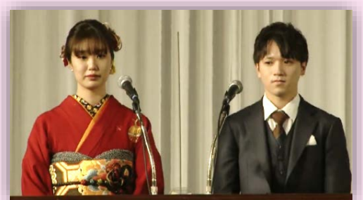
式典当日の様子（昨年度） 司会