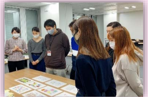
会議の様子（昨年度）