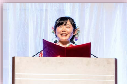
式典当日の様子（昨年度） 新成人の誓い