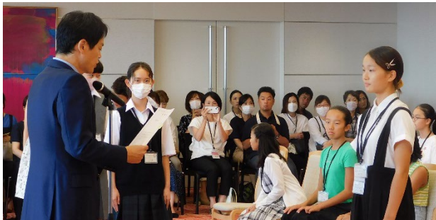
子どもピースメッセンジャーへの委嘱

※国連国際学校: 国連職員の家族などが在籍している私立のインターナショナル・スクール