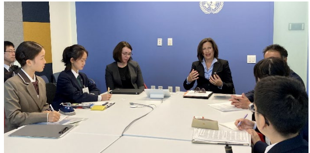
国連本部での対談