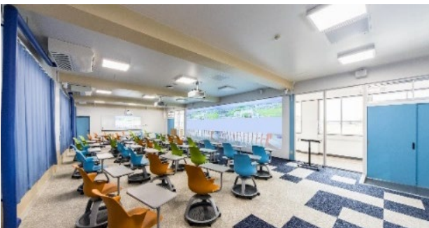
メタバース教室のイメージ