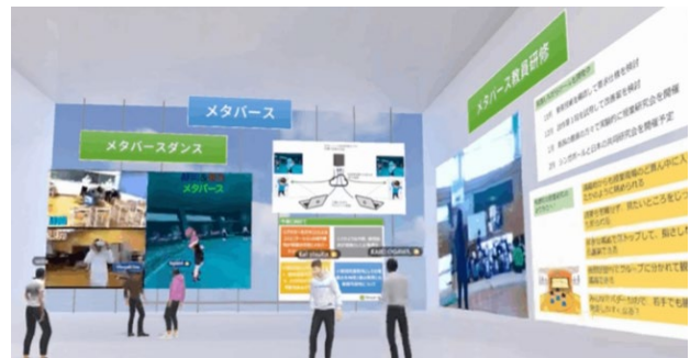
メタバース空間のイメージ