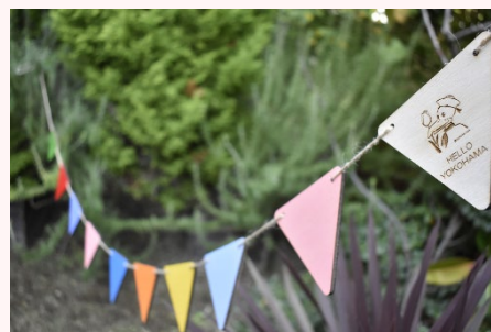
スウィングーガーランド