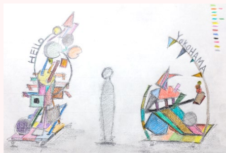
ウェルカムアート 完成イメージ図