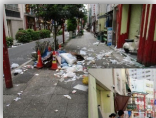
清掃前の福建路の様子

そして、これからもきれいな福建路を維持し、更に、花と緑による美しい通りを中華街に広めるため、地域の方々によるハマロード・サポーターが設立されることとなりました。