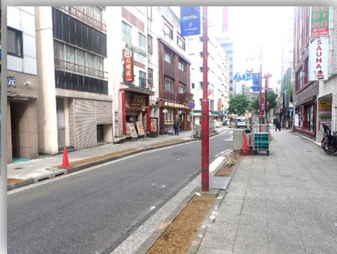
現在の福建路の様子