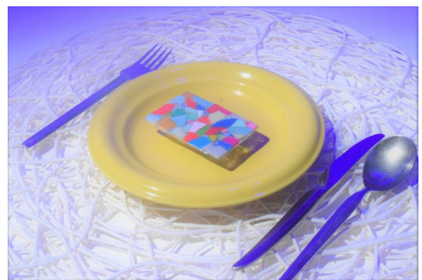
世界の人が平均して、毎週摂取しているといわれている プラごみの量＝クレジットカード1枚分（5g）のビジュアル