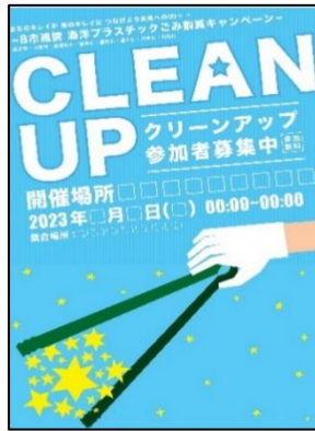
8市共通 参加者募集用

「まちのキレイが海のキレイに つなげよう未来への∞（ループ）」を共通スローガンとし、春・秋に市民や団体等が参加する一斉清掃活動と共通ポスター等を用いた啓発活動を令和4年度から行っています。