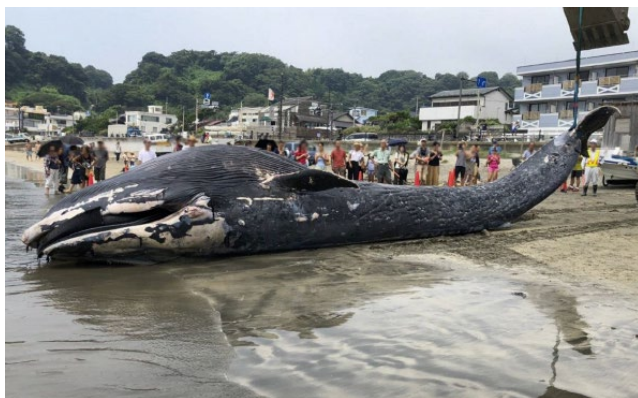
平成30年に鎌倉市の海岸に漂着したシロナガスクジラの赤ちゃんの胃の中からプラスチックごみが発見されました

(※) 横浜市、川崎市、横須賀市、鎌倉市、藤沢市、逗子市、大和市、町田市の市長で構成（詳細は最終頁）