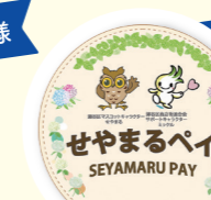
せやまるペイ (13,000円分)