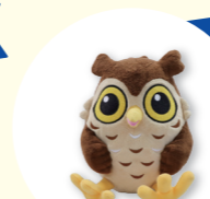
せやまるぬいぐるみ