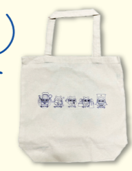
先着順 (なくなり次第終了)