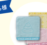
株式会社うんこ ハンドタオルセット