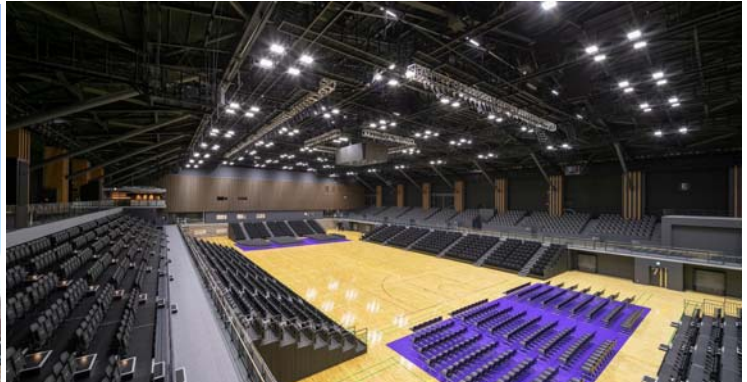
横浜武道館 アリーナ