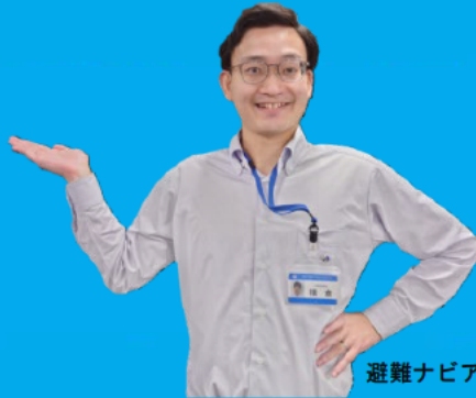
避難ナビアプリ担当