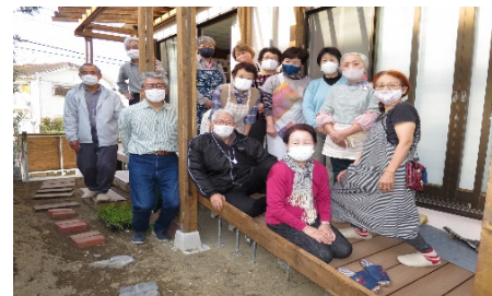
地域の人たちの手で造り上げたウッドデッキ。交流の場になっています。

ここを、 ヨコハマ市民まち普請事業 を利用して、 地域に開かれた「菊名みんなのひろば」 に整備しました。