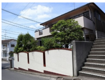
塀に囲まれた拠点。中の様子が見えず何の施設かが分かりませんでした。