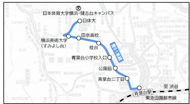
青61系統路線図（令和6年4月1日～）

東急バス青61系統は東急田園都市線の青葉台駅と日本体育大学の横浜・健志台キャンパスを結び、学生や沿線住民の方など大変利用者の多いバス路線です。このたび、当路線へ連節バスを導入し、輸送力を確保しつつ、利便性を維持しながら、運行便数を最適化するとともに、快適でスムーズな輸送サービスの提供を目指します。