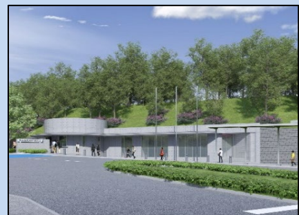
待合施設のイメージ図

学校法人日本体育大学にて、日本体育大学横浜・健志台キャンパスの交通広場に、バリアフリー対応の待合施設（冷暖房完備、トイレ併設）を整備しています。（令和6年3月末竣工予定）