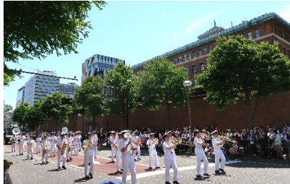
▲ 第71回「ザよこはまパレード」 … 戦災復興のさなかに行われた「国際仮装行列（昭和28年）」がルーツ。