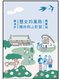
▲横浜市歴史的風致維持向上計画 本編・概要版表紙