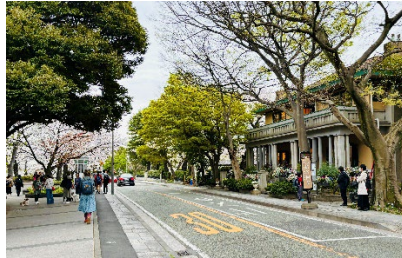
▲ 山手本通りの街並み … 長年にわたるまちづくり活動により、異国情緒ある街並みが守られている。