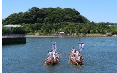
▲ 祇園舟神事（富岡八幡宮） … 青茅（あおかや）の船に罪穢れを託し流す行事。金沢区で800年以上続く。